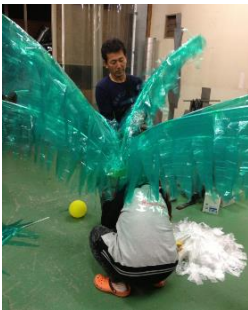
ヤシの木 作製風景 頑張りましたー！